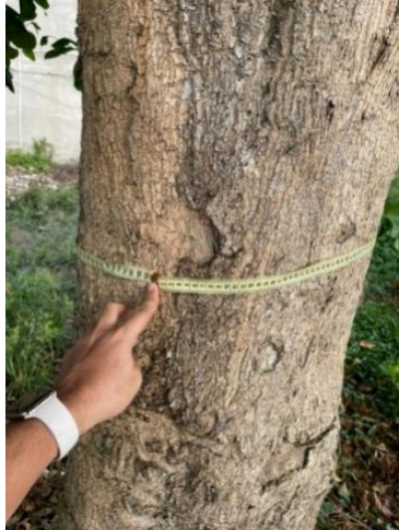
Imagen 2. Árbol en riesgo 8°53'31.30"N 75°47'47.10"O

inmobiliaria N143 – 19472, en la dirección K20B 18-10, barrio Venus III, de la señora ENA LUZ QUINTERO PERNETH con CC 34.977.850, por lo tanto el árbol se encuentra en propiedad privada. El certificado se enviará adjunto al presente concepto.