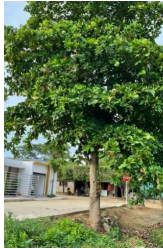
Imagen 3. Árbol con afectaciones mecánicas y fitosanitarias en la base, tronco y dosel inferior y medio 8°53'31.30"N 75°47'47.10"O